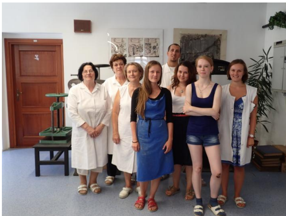
Obrázek 4: Kolektiv restaurátorů v ateliéru Univerzitné knižnice v Bratislavě