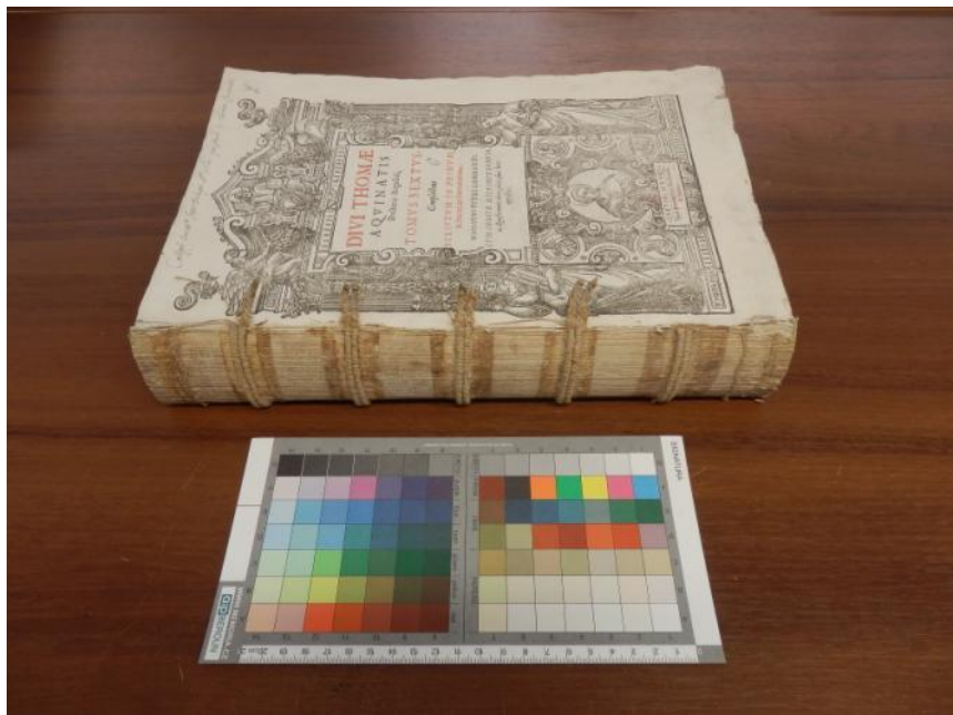
Obrázek 6: Přidělená práce na svazku Divi Thomae Aquinatis...