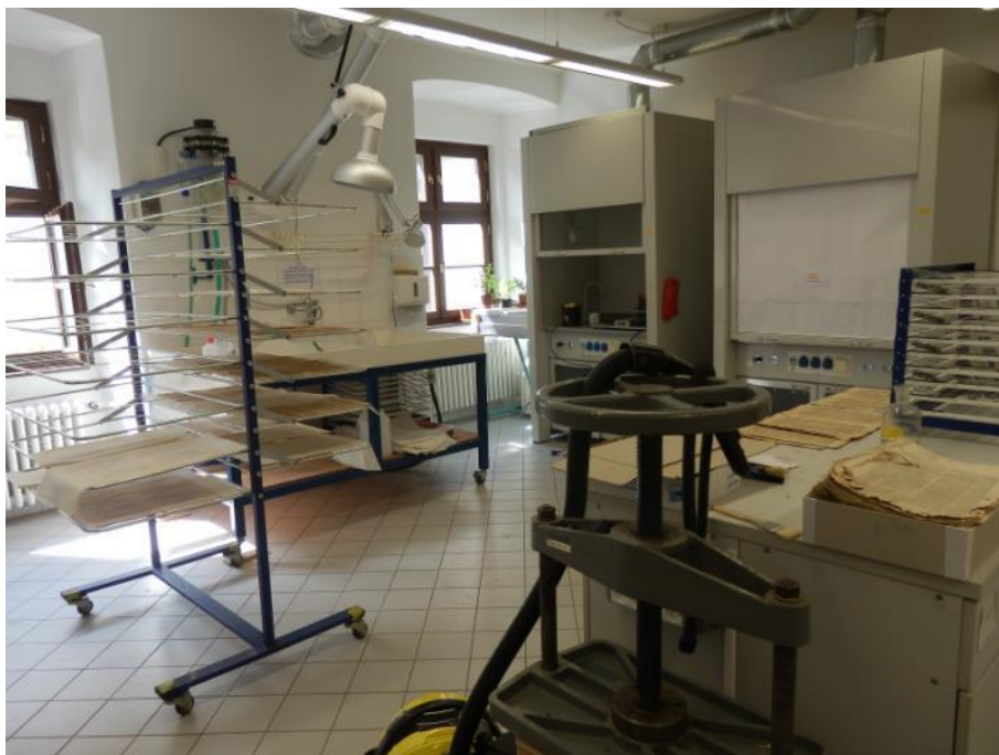
Obrázek 2: Restaurátorský ateliér, vybavení mokrých procesů