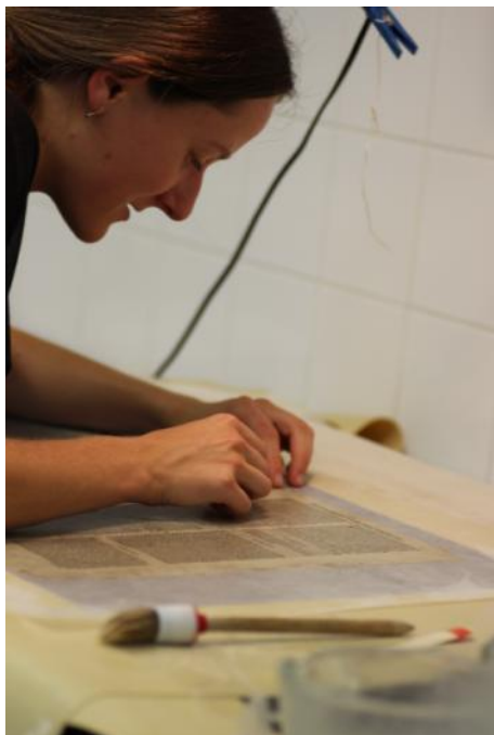
Obrázek 5: Pracovní fotografie, postup doplňování na vakuovém stole

DOCEO PRO CULTURA – Inovace vzdělávacích procesů Fakulty restaurování, reg. č. CZ.1.07/2.2.00/28.0268 závěrečná zpráva ze studentské odborné zahraniční stáže (KA3)