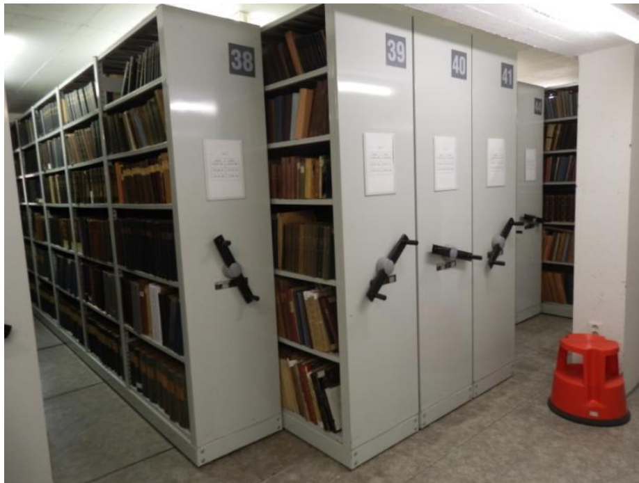
Obrázek 3: Ukázka posuvných regálů pro skladování knihovních fondů v klimatizovaném skladě

DOCEO PRO CULTURA – Inovace vzdělávacích procesů Fakulty restaurování, reg. č. CZ.1.07/2.2.00/28.0268 závěrečná zpráva ze studentské odborné zahraniční stáže (KA3)