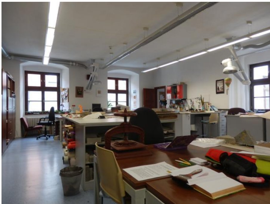
Obrázek 1: Restaurátorský ateliér, hlavní místnost