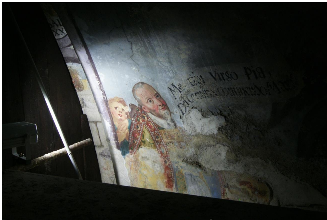
Obr. 8: Část malby z konchy, kde barevná vrstva tvořila puchýře (zde jsem prováděla např. fixaci barevné vrstvy či injektáž)