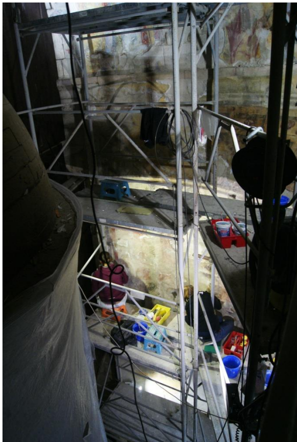
Obr. 3: Pohled na pracoviště

DOCEO PRO CULTURA – Inovace vzdělávacích procesů Fakulty restaurování, reg. č. CZ.1.07/2.2.00/28.0268 závěrečná zpráva ze studentské odborné zahraniční stáže (KA3)