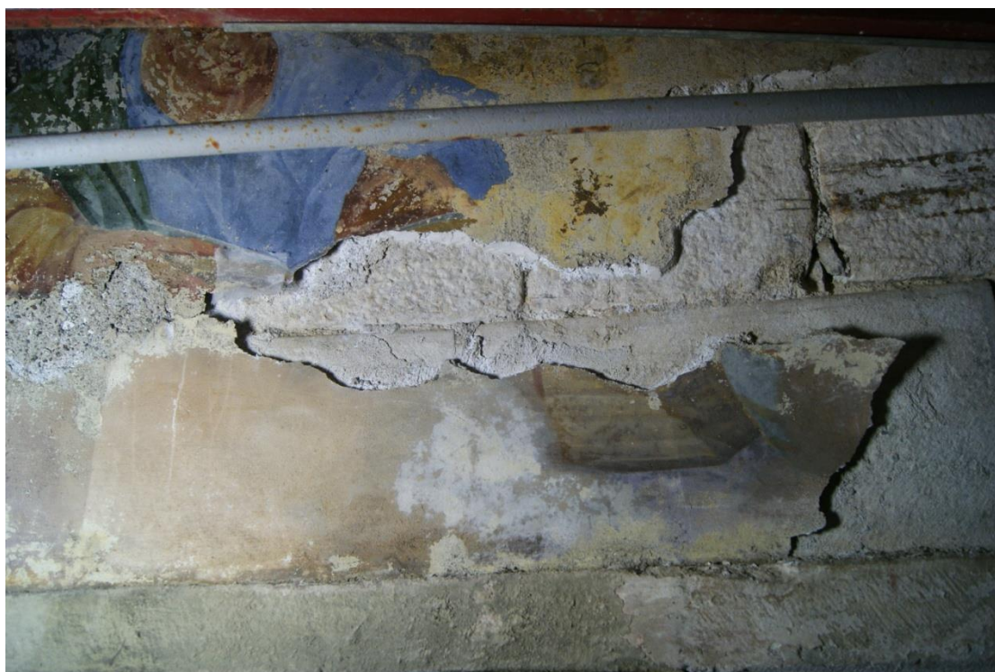
Obr. 6: Detail poškození - omítka je místy zcela vydrolená, takže malbě chybí podklad (tato místa byla zpevněna strukturálně, obtmelená a injektována)