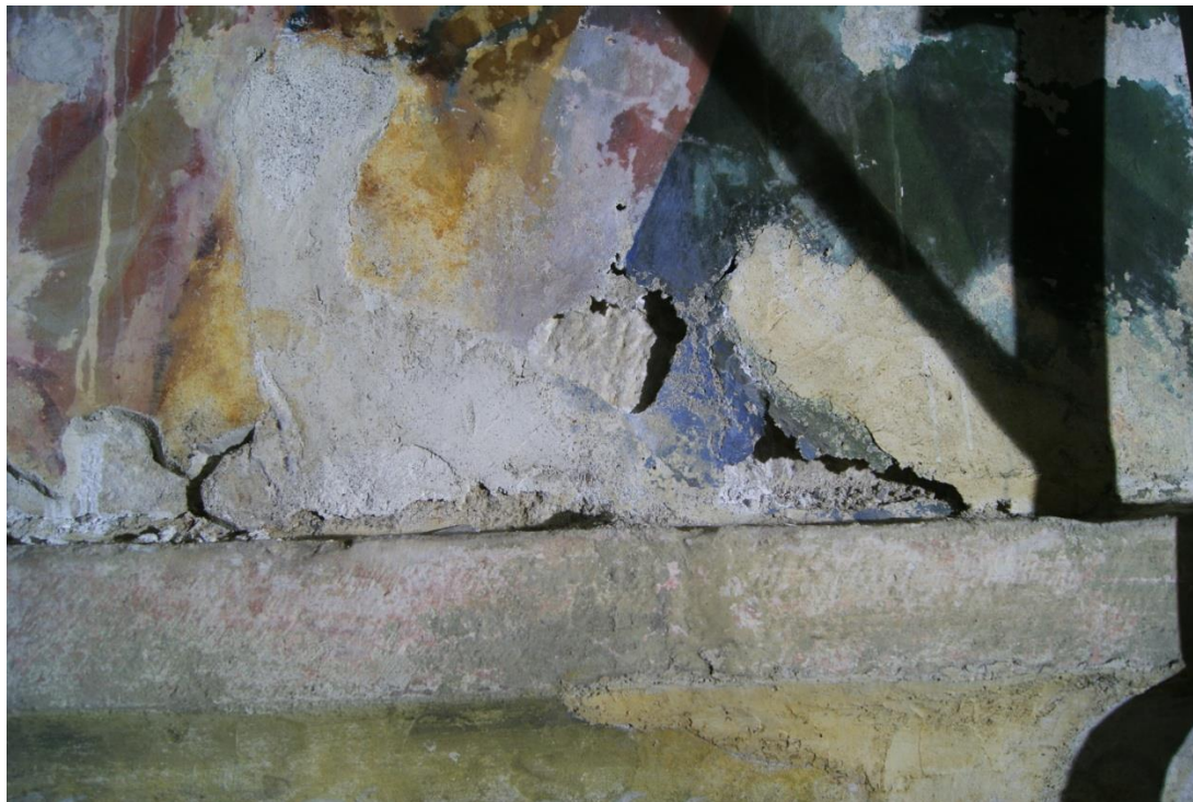
Obr. 7: Totéž poškození, jako obr. 6, poškození je zde způsobeno nevhodnou sádrovou vysprávkou

DOCEO PRO CULTURA – Inovace vzdělávacích procesů Fakulty restaurování, reg. č. CZ.1.07/2.2.00/28.0268 závěrečná zpráva ze studentské odborné zahraniční stáže (KA3)