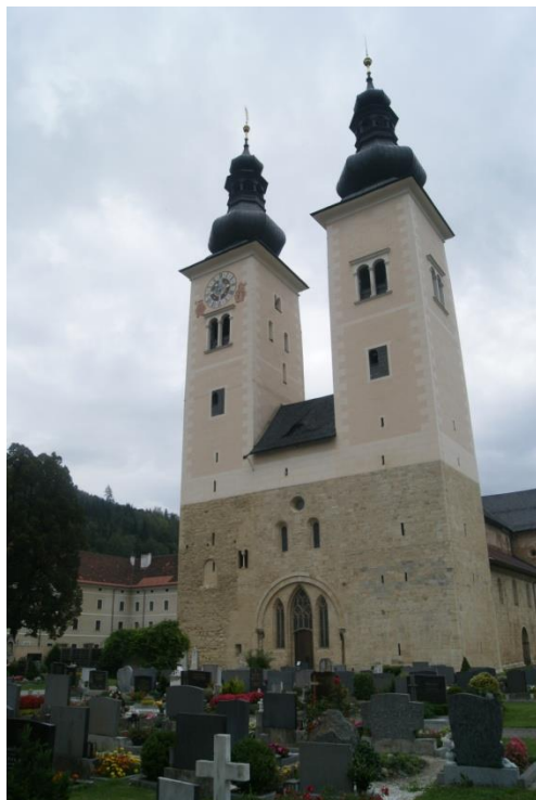
Obr. 1: Průčelí dómu v Gurku