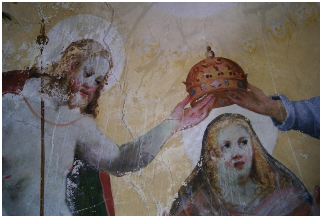
Obr. 5: detail malby v konše apsidy - Kristus korunující Pannu Marii (figury vysoké cca 2,5m), je zde znát poškození barevná vrstva

DOCEO PRO CULTURA – Inovace vzdělávacích procesů Fakulty restaurování, reg. č. CZ.1.07/2.2.00/28.0268 závěrečná zpráva ze studentské odborné zahraniční stáže (KA3)