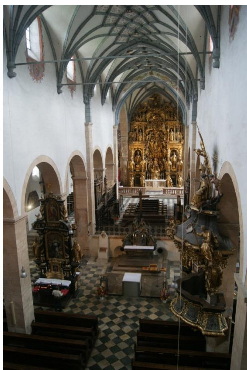
Obr. 2: Interiér dómu s pohledem na hlavní oltář, za nímž se nachází apsida s restaurovanou malbou