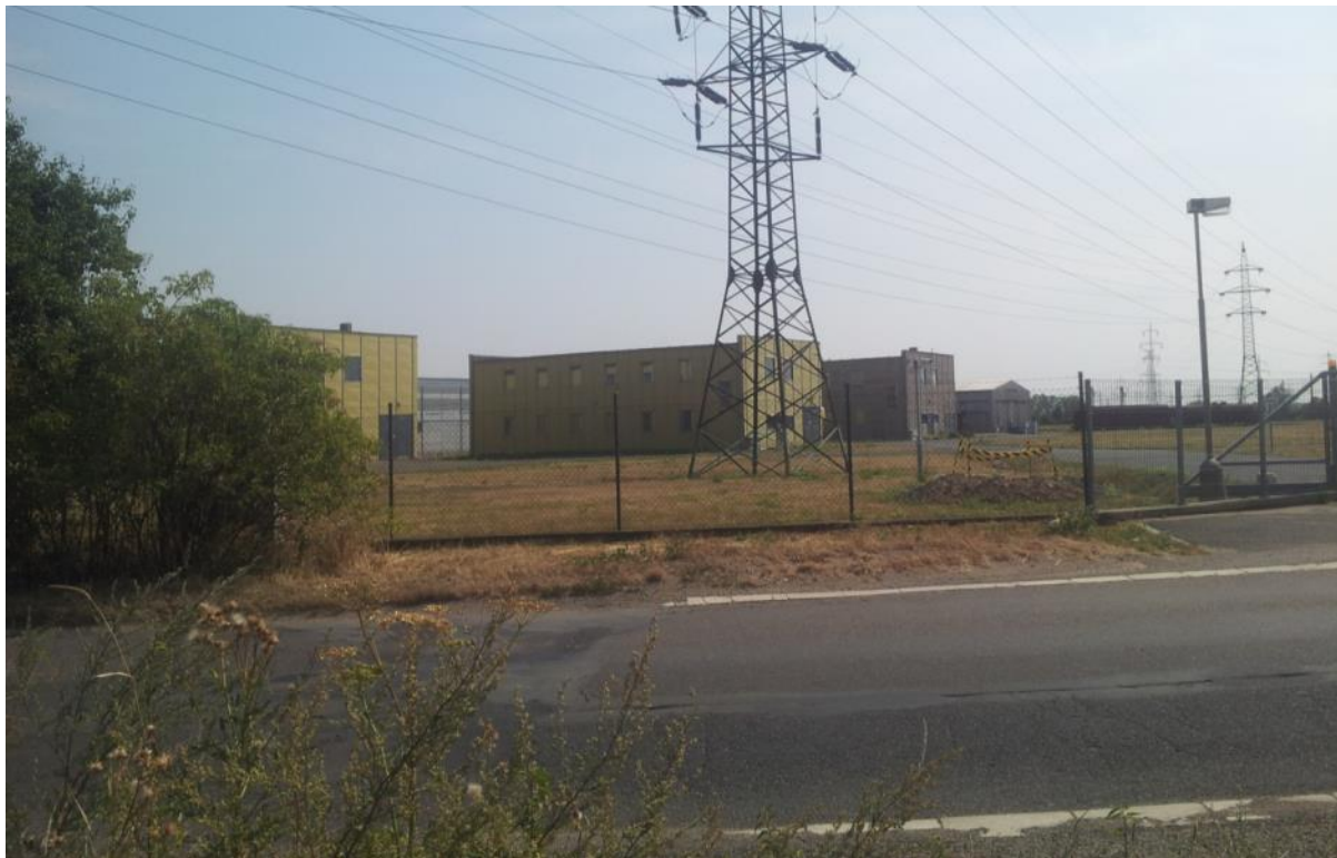
Obrázek 4. Pohled na areál depozitáře NTM v Čelákovících.

DOCEO PRO CULTURA – Inovace vzdělávacích procesů Fakulty restaurování, reg. č. CZ.1.07/2.2.00/28.0268 závěrečná zpráva ze studentské stáže v aplikačním sektoru (KA4)