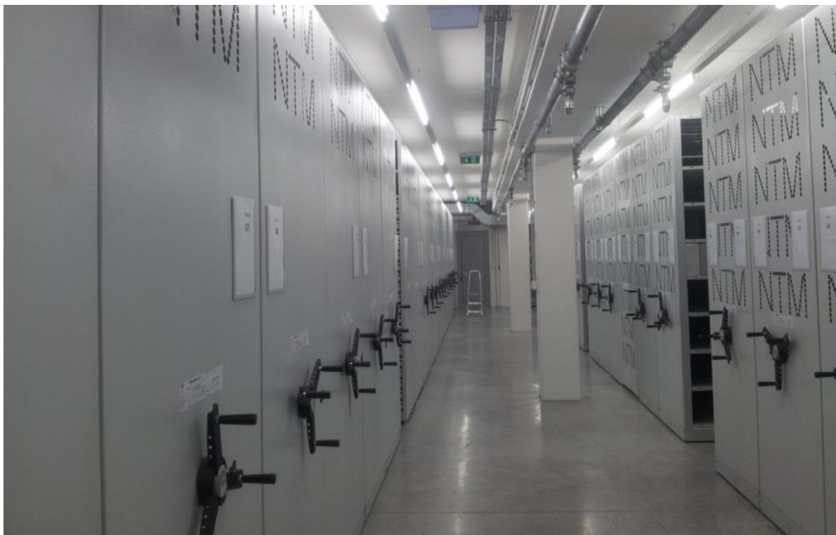
Obrázek 5. Způsob uložení sbírkových předmětů v pojízdných policích.