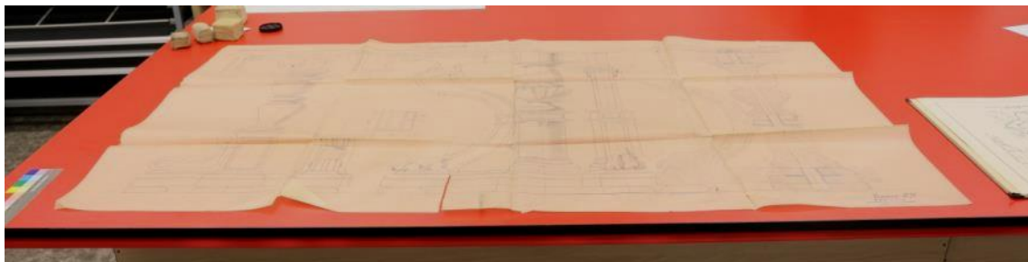
Obrázek 1. Pauzovací papír Salónního vozu Františka Josefa I. před restaurováním