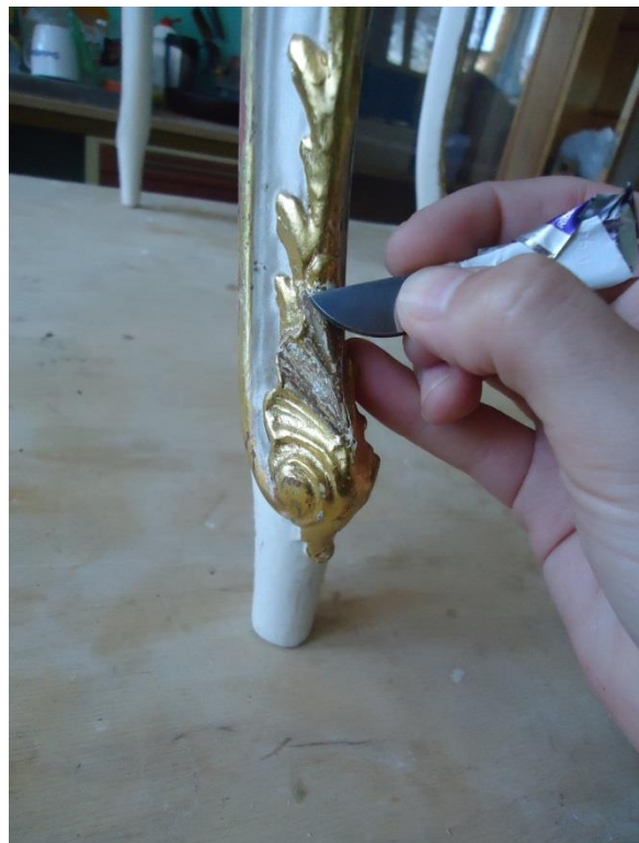
Obrázek 11 Snímání sekundárních úprav