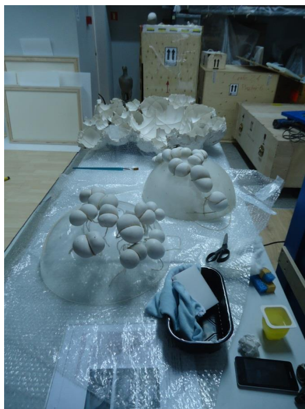
Obrázek 8 Další čištěná umělecká díla