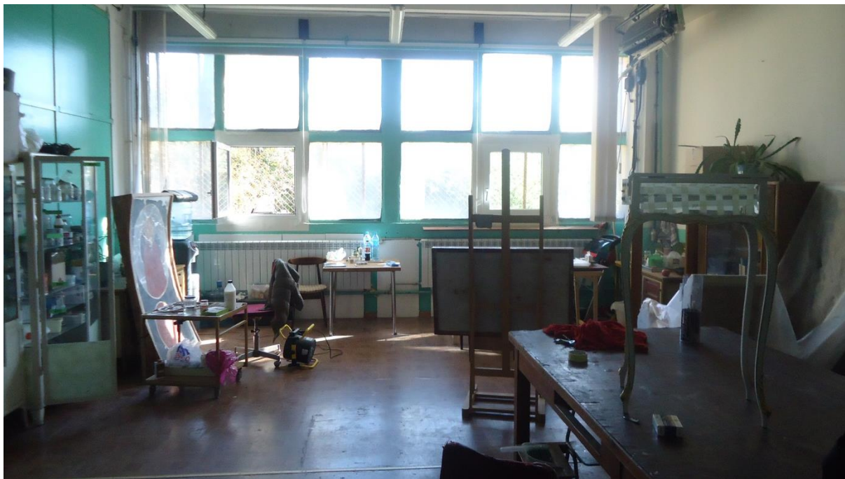
Obrázek 9 Jedna z místností pracovny Monument Service ve Varšavě

Pracoviště- Pracovna Monument Service ve Warszavie