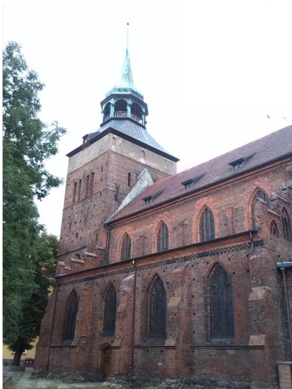
Obrázek 1 Kostel Narození Nejsvětější Panny Marie