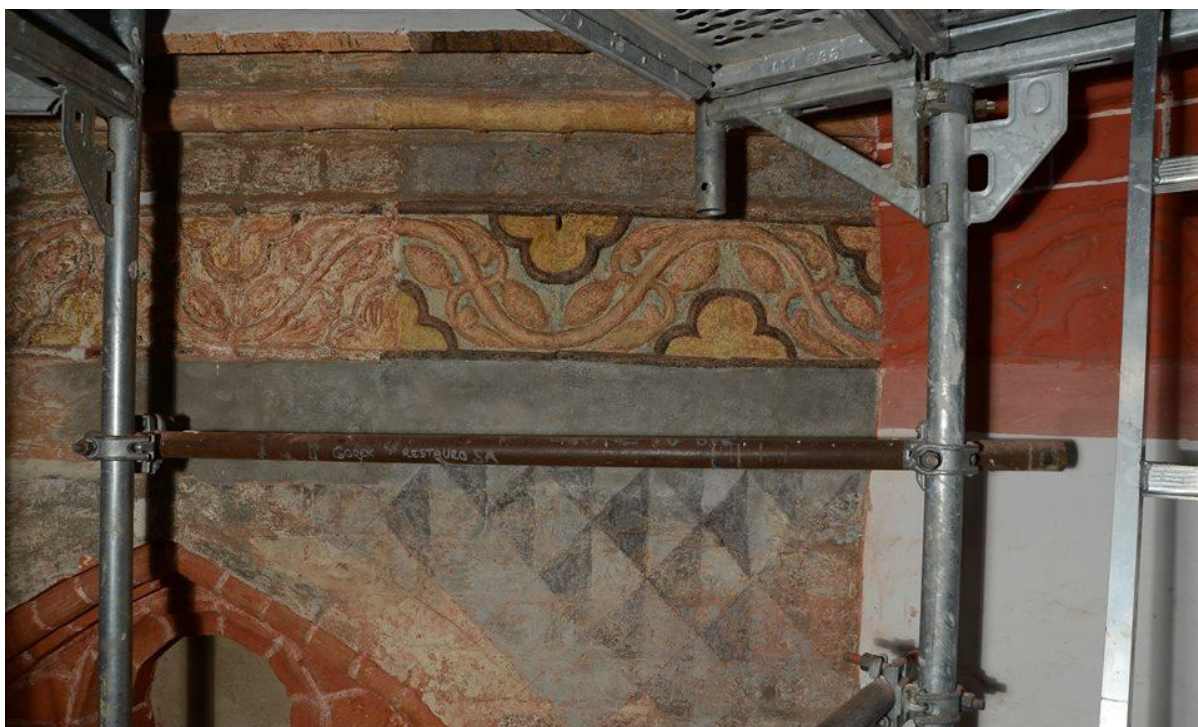
Obrázek 5 Rekonstrukce barevného pojednání již v podání magistry Moniky Pařky