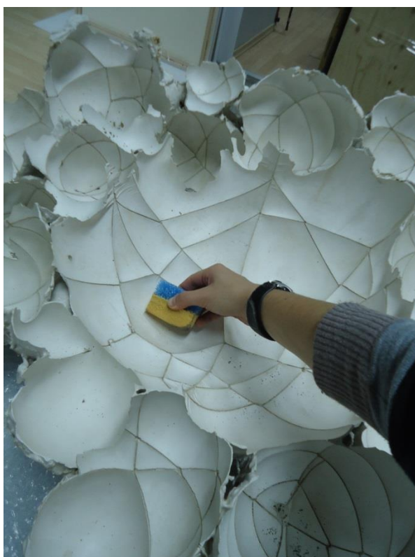
Obrázek 7 Čištění plastiky od Márii Bartuszové