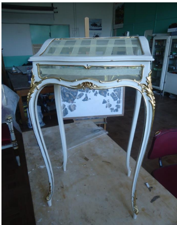
Obrázek 10 Dřevěná vitrínka ze 17. století