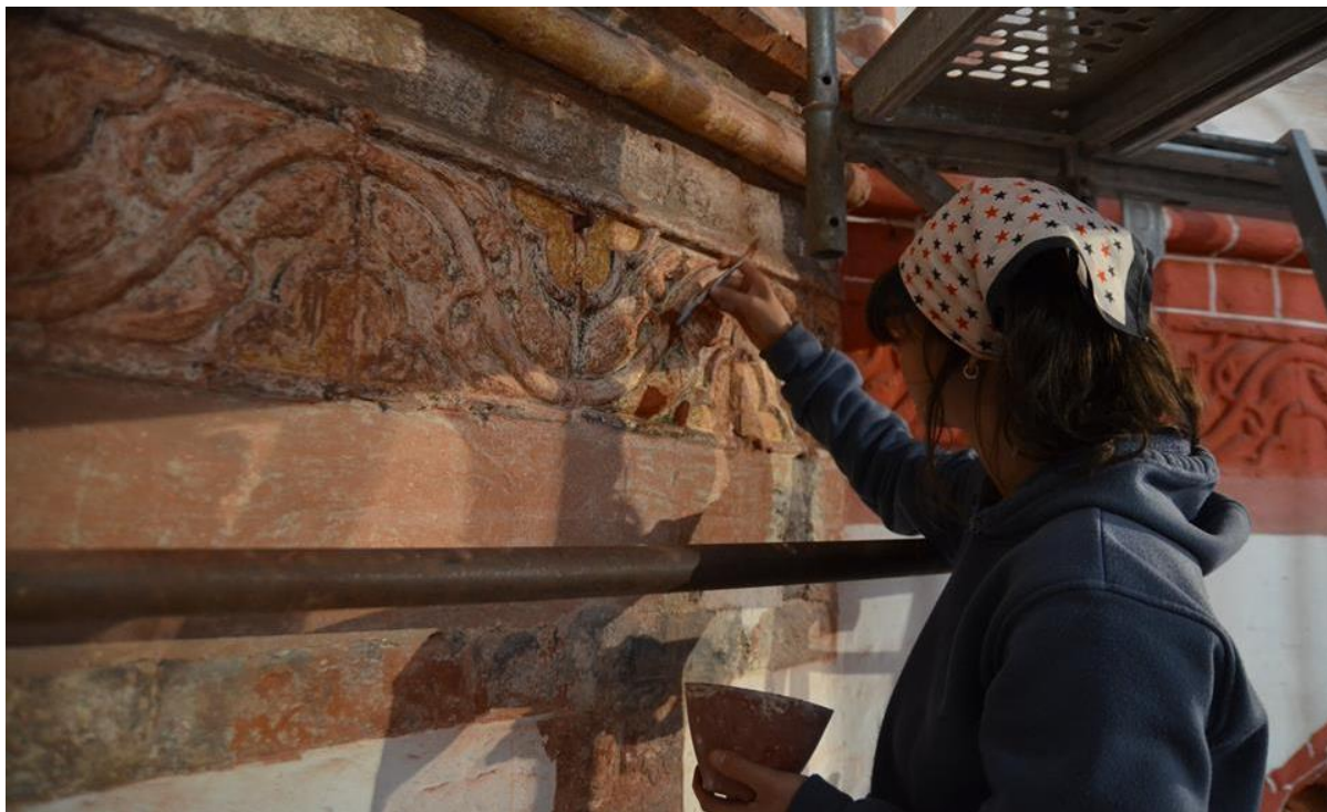
Obrázek 4 Tmelení poškozených míst vlysu

DOCEO PRO CULTURA – Inovace vzdělávacích procesů Fakulty restaurování, reg. č. CZ.1.07/2.2.00/28.0268 závěrečná zpráva ze studentské odborné zahraniční stáže (KA3)