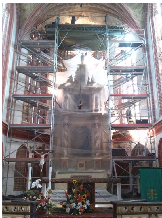
Obrázek 2 Interiér kostela - presbytář s lešením