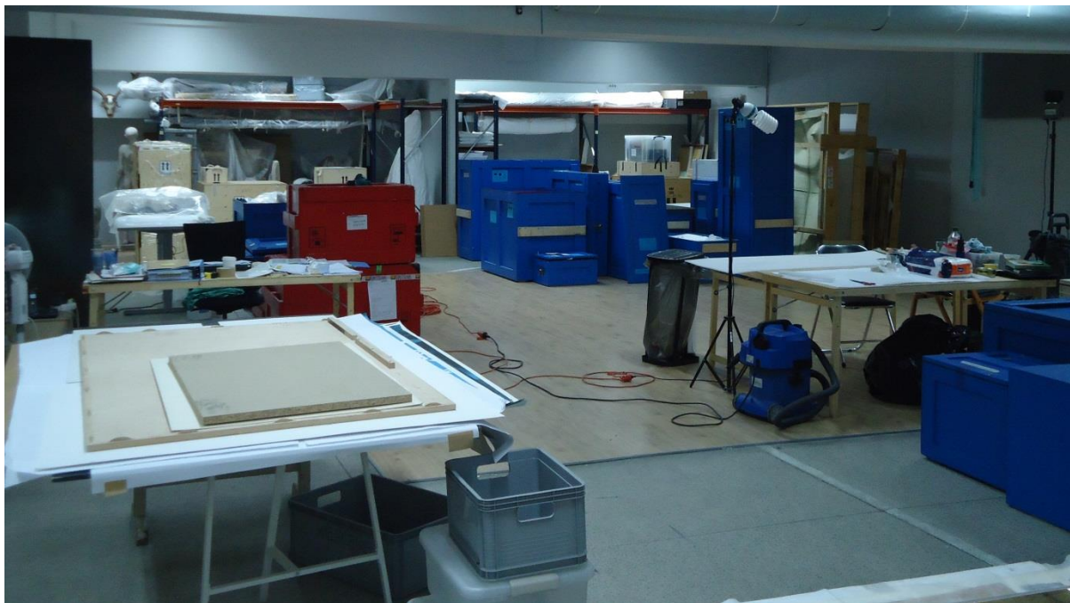
Obrázek 6 Pracoviště a sklad uměleckých objektů v Muzeu moderního umění

Pracoviště - Muzeum Sztuki Nowoczesnej w Warszawie